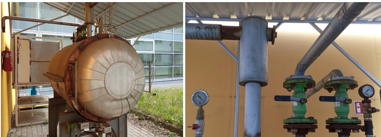
2. ábra. A vákuum-nyomásos kezelőhenger (bal) és szabályozó csapjai, mérőórái (jobb)

A faanyagok telítése a Soproni Egyetem Faipari Mérnöki és Kreatívipari Karához tartozó vákuum-túlnyomásos telítőhengerben zajlott. A vizsgálatok tárgyát képező elővákuumos telítési eljárásokhoz használt berendezés egy vízszintes elrendezésű, rozsdamentes kazánlemezből készült arányos tartály, amelynek az egyik edényfeneke karimás kötéssel, a másik hegesztéssel kapcsolódik a nyomástartó edény köpenyéhez. A karimás kötés 12 hatlapfejű csavarral történik. Az ergonomikus munkavégzés segítésére a készüléknyereg szokatlanul magas. A tartály aljában található egy sínpár, amelyen a telítőkádat be lehet tolni a hengerbe. Az henger üvegyapot hőszigetelését kívülről alumínium lemezzel burkolták. A telítőhenger köpenyén több kialakított csőcsomok található különböző átmérőkkel, melyek segítségével megoldható a túlnyomást biztosító kompresszor, a vákuumszivattyú és a nyomásmérő műszerek csatlakoztatása. A berendezés használatakor a tartályban zajló folyamatok vezérlése egy nagyméretű kapcsolótáblával történik, amely egy PLC közbeiktatásával mágneskapcsolókkal kapcsolja ki/be a vákuumszivattyút [5]. A hengerben uralkodó nyomás, illetve vákuum méréséhez a henger tetején található a mérőórák, valamint a szabályozásukhoz használatos csapok.