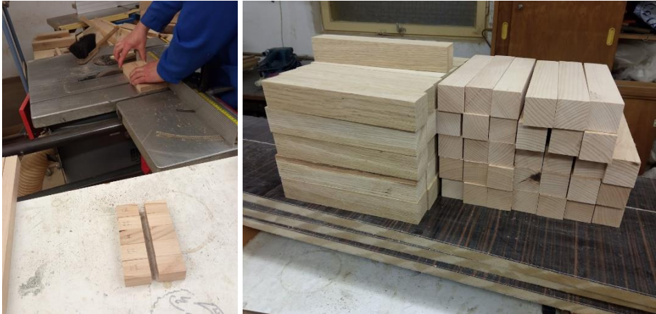
1. ábra. Anyagvizsgálati próbatetek végleges méretének kialakítása (bal) és elkészült telítési próbatetek (jobb)

A CEN EN 14734 szabványban [12] meghatározott réz-szulfát 5%-os desztillált vizes oldatát alkalmaztuk a telítési vizsgálatok végrehajtáshoz. Ugyan a legtöbb napjainkban használatos faanyagvédőszer-hatóanyag, többek között a réz-, króm-, arzenát- és cink vegyületek is mérgező hatásúak emberre, állatra és környezetre [3], jelen kísérletek során a faanyagok kezelése – és ártalmatlanítása – védőfelszerelésben és körültekintően történt. Az említett szabvány [12] a benne meghatározott indikátor oldat, króm-azurool S és nátrium-acetát desztillált vizes oldatának alkalmazásával lehetőséget nyújt a penetráció vizuális értékelésére is, viszont ezeket az eredményeket jelen cikkben nem, csak a tömegfelvételi eredményeinket publikáljuk.