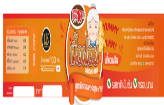
ภาพที่ 1.6 แบบบรรจุก้อนเนื้อฝอย

3. บรรจุก้อนเนื้อฝอย มีลักษณะเป็นกระปุกใส ฝาดำ 8.5 x 8.5 เซนติเมตร ติดสติ๊กเกอร์บนบรรจุก้อน จะมีภาพและรายละเอียดต่าง ๆ เกี่ยวกับผลิตภัณฑ์ ปรากฏด้านหน้าบรรจุก้อน เช่น โลโก้กลุ่ม คุณสมบัติของ ผลิตภัณฑ์ ราคา และน้ำหนัก