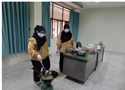
ภาพที่ 1.7 การถ่ายทอดองค์ความรู้การทำผลิตภัณฑ์สหกรณ์โคเนื้อมือนารอ