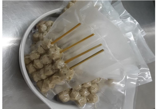
ภาพที่ 1.2 ผลิตภัณฑ์ลูกชิ้นเนื้อ

1. ลูกชิ้นเนื้อ เป็นการพัฒนาผลิตภัณฑ์ลูกชิ้นเนื้อที่มีความนุ่มเต่งด้วยสูตรเฉพาะและไม่ใช้สารปรุงแต่งอื่นใดมาผสม ไม่มีกลิ่นคาวของเนื้อแต่ยังได้รสสัมผัสของเนื้อชัดเจน และได้รับการรับรองฮาลาล แพ็คด้วยถุงซีลสุญญากาศ ขนาด 20 x 30 เซนติเมตร มีอายุการเก็บรักษาโดยการแช่เย็น อุณหภูมิ 0 - 5 องศาเซลเซียส นาน 7 วัน ขนาดจำหน่าย 1 ไม้ มี 3 ลูก และราคาจำหน่าย 15 บาทต่อไม้ ต้นทุนการผลิตต่อหน่วยจำหน่าย 342.40 บาทต่อกิโลกรัมและต้นทุนบรรจุภัณฑ์ต่อหน่วยจำหน่าย 21 บาทต่อถุง