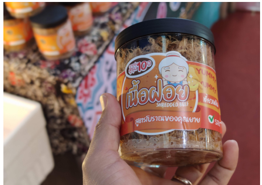
ภาพที่ 1.3 ผลิตภัณฑ์เนื้อฝอย

2. เนื้อฝอย เป็นการพัฒนาผลิตภัณฑ์จากเนื้อวัวที่เหลือจากการจัดจำหน่ายเนื้อสด ได้ร่วมคิดหาวิธีที่จะไม่ทำให้เนื้อเสียไปแบบเปล่าประโยชน์และได้นำมาแปรรูปเป็นเนื้อฝอยแพ็คด้วยกระปุกใสแบบฝาปิดสนิทสีดำ ขนาด 8.5 x 8.5 เซนติเมตร มีอายุการเก็บรักษาในอุณหภูมิห้องได้นาน 14 วัน ขนาดจำหน่าย 100 กรัมต่อกระปุก และราคาจำหน่าย 150 บาทต่อกระปุก ต้นทุนการผลิตต่อหน่วยจำหน่าย 451 บาทต่อกิโลกรัม และต้นทุนบรรจุภัณฑ์ต่อหน่วยจำหน่าย 22.5 บาทต่อกระปุก