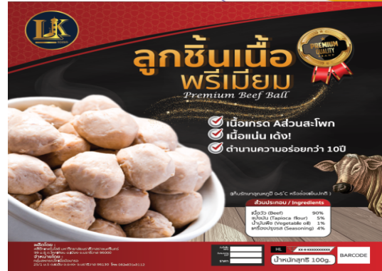
ภาพที่ 1.5 แบบบรรจุก้อนลูกชิ้นเนื้อ

2. บรรจุก้อนลูกชิ้นเนื้อ มีลักษณะเป็นถุงใสซิล สูญญากาศ ขนาด 20 x 25 เซนติเมตร ติดสติ๊กเกอร์ ด้านหน้าบนบรรจุก้อนจะมีภาพและรายละเอียดต่าง ๆ เกี่ยวกับผลิตภัณฑ์ปรากฏด้านหน้าบรรจุก้อน เช่น โลโก้ กลุ่ม คุณสมบัติของผลิตภัณฑ์ ราคา และน้ำหนัก